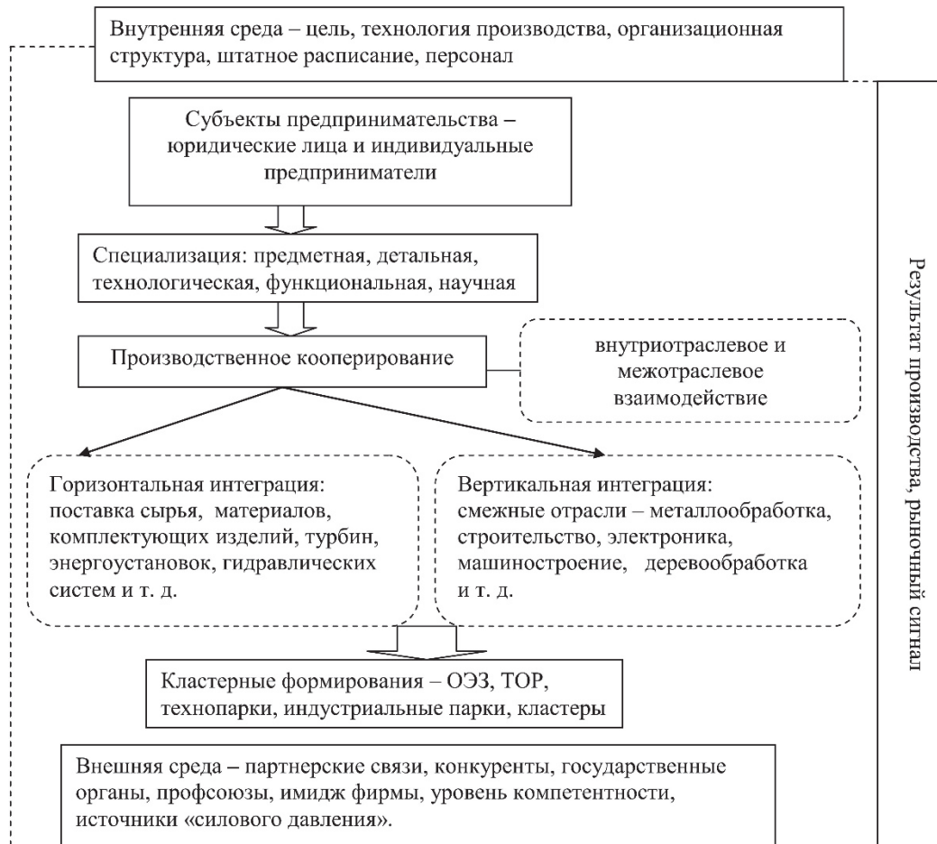
Рис. 1. Схема взаимодействия хозяйственных связей и территориальной интеграции предпринимательских структур (на примере судостроительной отрасли)