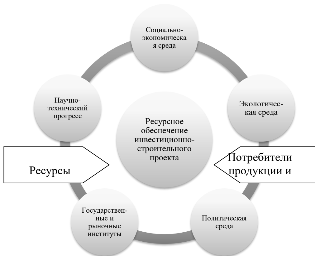
Рис. 2. Макро- и микросреда ресурсного обеспечения инвестиционно-строительных проектов

Взаимосвязь и взаимовлияние макро- и микросреды ресурсного обеспечения инвестиционно-строительных проектов наглядно представлено на рис. 2.