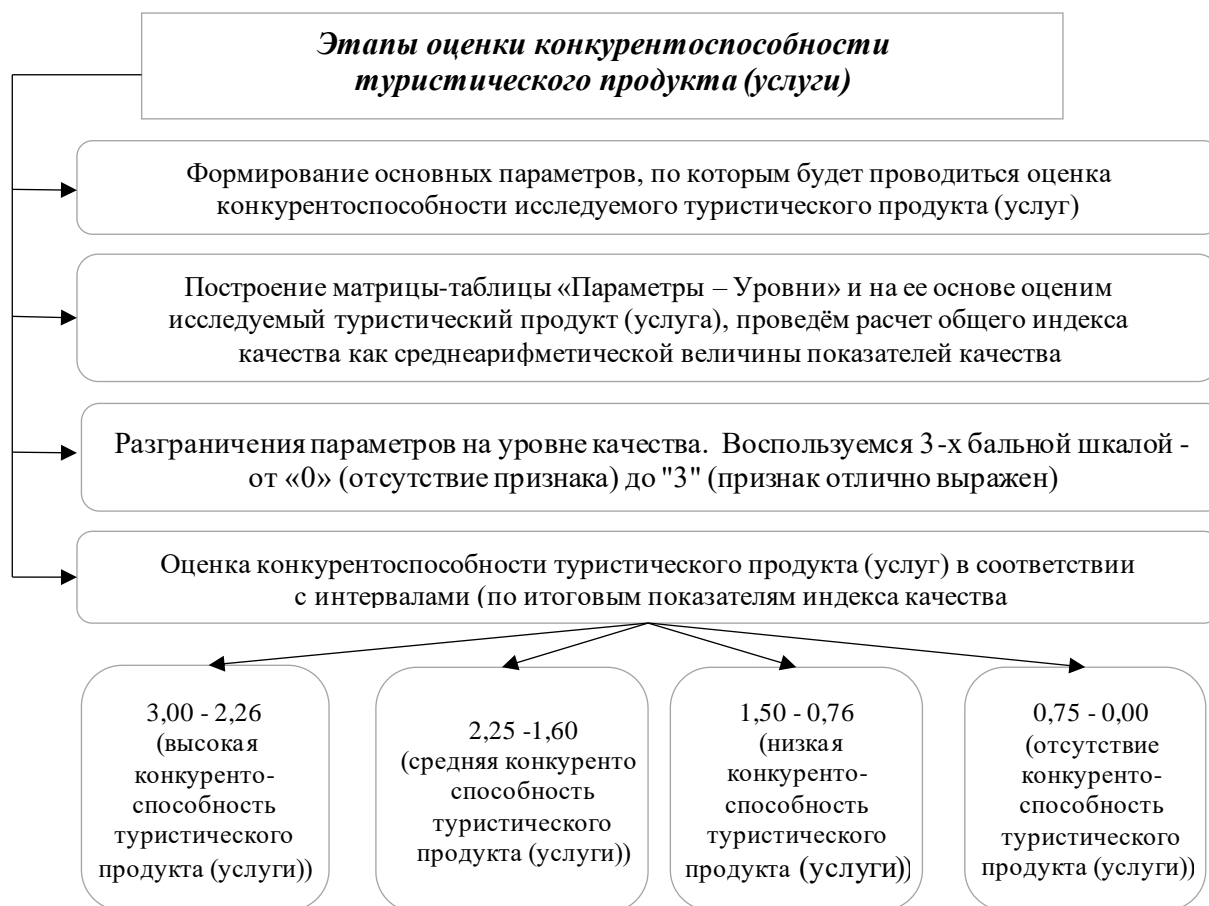
Рис. 2 Этапы оценки конкурентоспособности туристического продукта (услуги) [3,13].

Общая оценка: «отлично» – 20-25 баллов; «хорошо» – 15-19 баллов; «удовлетворительно» – 14-18 баллов; «неудовлетворительно» – 13 баллов и меньше. Исходя из вышеприведенного сравнения, можно сделать следующий вывод: туристические фирмы «Рюкзак путешествий» и «TRAVEL.STORE» попадают в поле «отличной» оценки, в то время как туристическая фирма «Крымская Компания Путешествий» может быть оценена только на «хорошо».